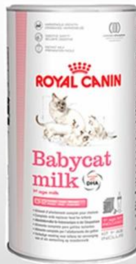
Размер упаковки банка 300 г

Докозагексаеновая кислота (DHA) входит в состав материнского кошачьего молока. Она необходима котяткам в подсосный период, который является очень важной фазой для развития головного мозга. Поэтому заменитель молока Babycat Milk обогащен EPA и DHA - эйкозапентаеновой и докозагексаеновой кислотами.